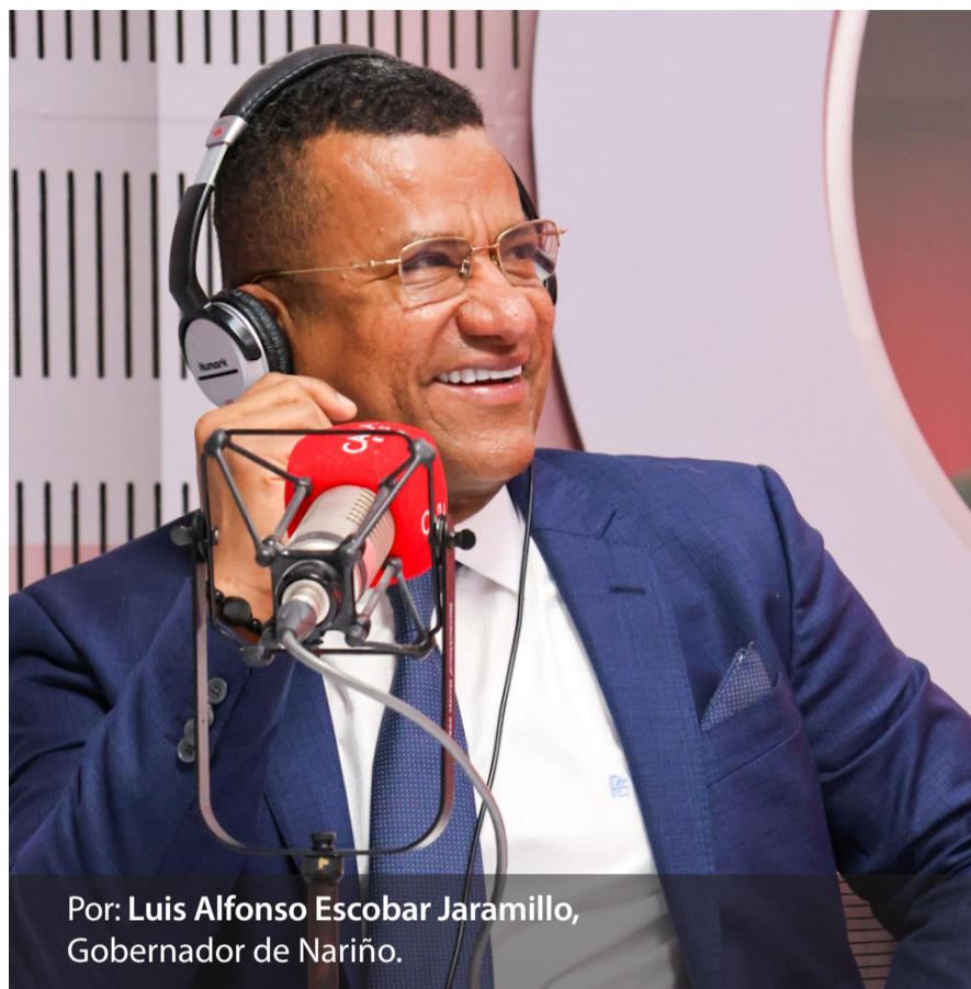
Por: Luis Alfonso Escobar Jaramillo, Gobernador de Nariño.

Desde 1615 inició el saqueo del oro en Barbacoas. Luego, con el inicio de la República hacia 1819 y hasta la fecha la extracción indiscriminada dejó una huella de pobreza y miseria. Para hacernos a una idea del contexto que viven los territorios que recibieron estos impactos, podemos citar como ejemplo al Municipio de Magüí, en donde la pobreza multidimensional es del 85%, mientras el país tiene un indicador del 13% y el Departamento de Nariño el 19%.